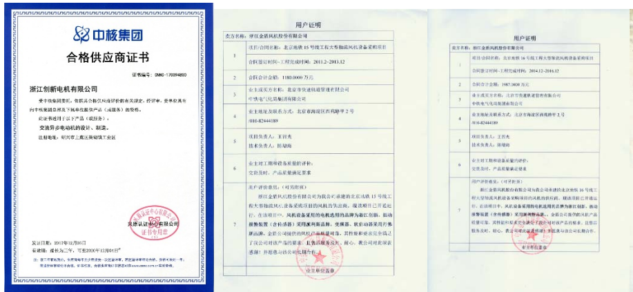
图 3 客户认可示例