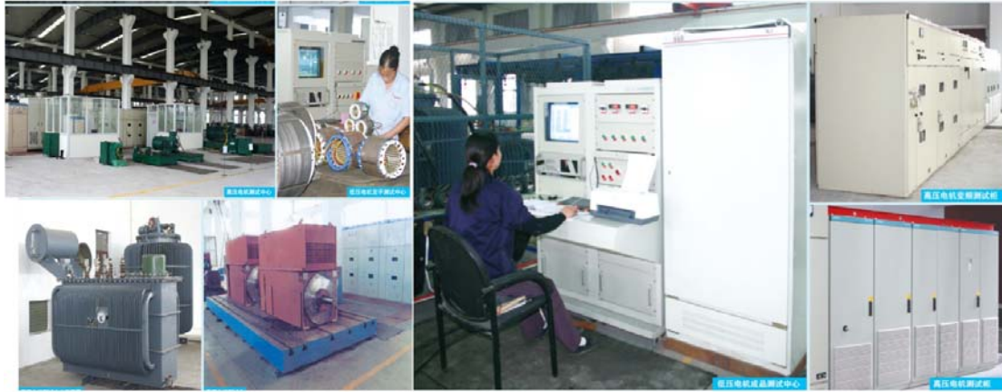
图 2 公司先进检测设备